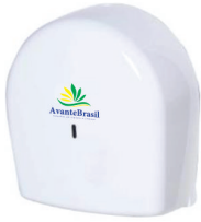
TOALHEIRO HIGIÊNICO ROLÃO