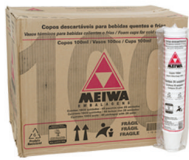
COPO TÉRMICO 100ml / 180ml / 250ml