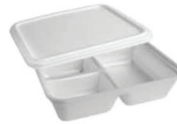
BANDEJAS DE ISOPOR