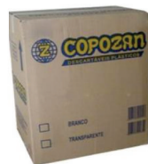
POTES E TAMPAS 100ml / 200ml