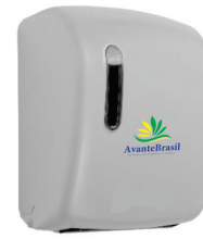
TOALHEIRO AUTO CORTE