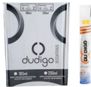
COPOS DESCARTÁVEIS 50 ml / 80ml / 110ml 180ml / 200ml / 300ml BRANCO / TRANSPARENTE